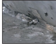
VA-Schrauben in Alu-Schweißnaht