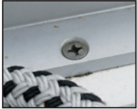
VA-Schraube in Alu-Fussreling