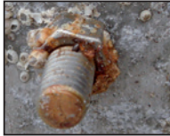
Korrodierte VA-Schraube in Alu