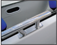
Edelstahlbeschlag auf Aluminiumrumpf