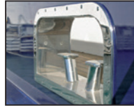
Edelstahlbeschlag in Alu-Aussenhaut

TIKAL TEF-GEL® ist eine wasserfeste, auf PTFE basierende Paste die das Aufblühen von Metall verhindert und zuverlässig Korrosion durch galvanische Ströme zwischen unterschiedlichen Metallen verhindert. Überall dort, wo edle Metalle mit unedleren Metallen (z.B. Aluminium mit Edelstahl) in direkten Kontakt kommen, genügt bereits eine geringe Menge TIKAL TEF-GEL® um den galvanischen Austausch von Elektronen und die daraus folgende Korrosion zu verhindern.